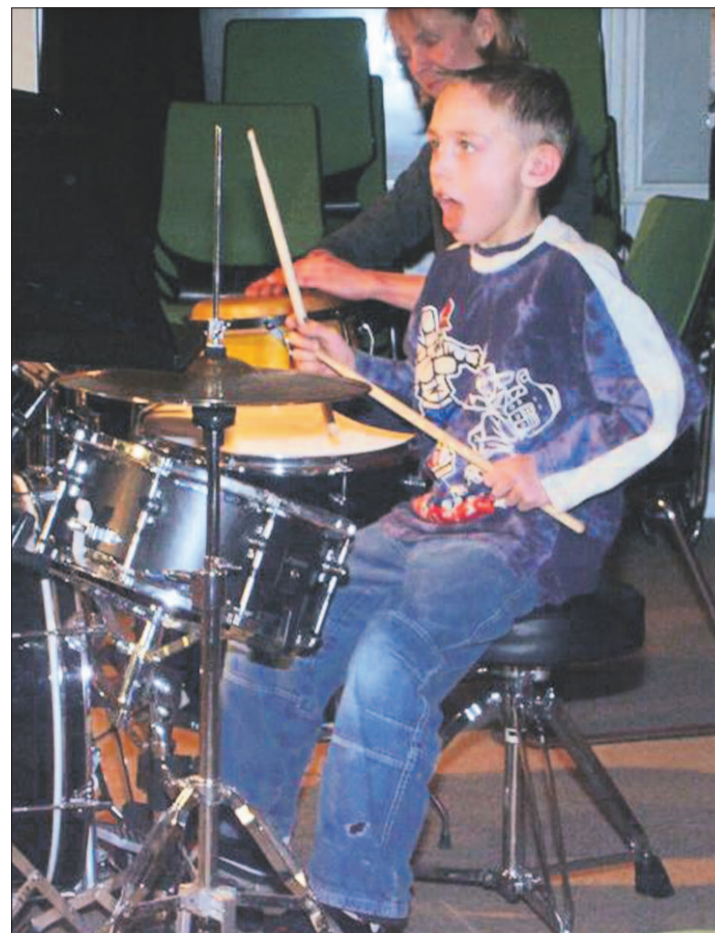
Eins! Zwei! Eins, zwei, drei, vier!

und Kontrabass. An vierter Stelle finden sich bereits seltenere Musikinstrumente wie zum Beispiel Drehleier, Gambe und Hackbrett, gefolgt von den Perkussionsinstrumenten. Hierzu gehören das in dieser Gruppe meistbeliebte Schlagzeug, sowie Xylophon und Marimbaphon. Blechbläser und Sänger bilden die kleinste Gruppe.